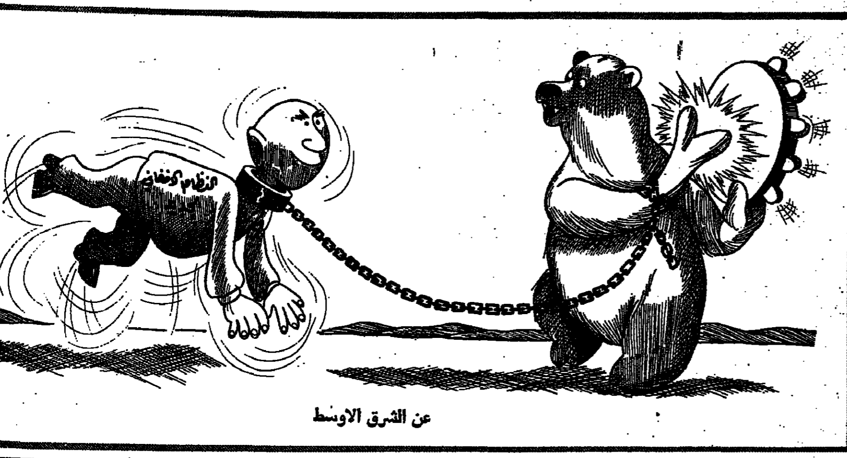
عن الشرق الاوسط

بانت صيحة هذا القول الجريء، كما ليس ثمة دليل على ان الحكومة الجديدة التي قامت بفرض السيطرة على أفغانستان قد اعتمدت سياسة من نوعها تجاه الحكم السوفياتي. وقد أعلن الخميني في مقابلة مع صحفيين في طهران ان الحكومة الجديدة في أفغانستان ستعطي الروس الحرية الكاملة في العودة الى بلادهم متى ما أرادوا. وقد صرح الخميني في مقابلة مع صحفيين في طهران ان الحكومة الجديدة في أفغانستان ستعطي الروس الحرية الكاملة في العودة الى بلادهم متى ما أرادوا. وقد صرح الخميني في مقابلة مع صحفيين في طهران ان الحكومة الجديدة في أفغانستان ستعطي الروس الحرية الكاملة في العودة الى بلادهم متى ما أرادوا.